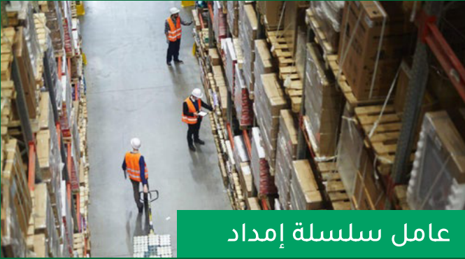
عامل سلسلة إمداد